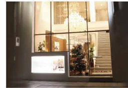
CUT·S 元町店 広島県福山市元町13-27 1F TEL.084-921-7175