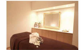
カツエステ&ネイル元町店 広島県福山市元町13-27 2F/3F TEL.084-925-2696