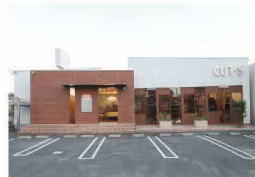
CUT·S 神辺店 広島県福山市神辺町新徳田33 TEL.084-960-0260