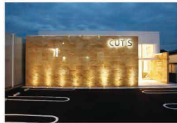
CUT·S vido 広島県福山市入船町3-3-8 TEL.084-973-7877