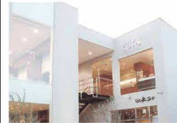
CUT·S 春日店 広島県福山市春日町1-1-45 2F TEL.084-940-0103