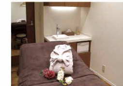
カツエステ神辺店 広島県福山市神辺町新徳田33 TEL.084-960-0260