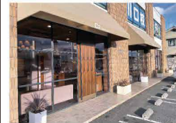
C2 川口店 広島県福山市川口町4-12-40 TEL.084-959-4005