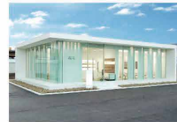
CUT·S 笠岡店 岡山県笠岡市富岡9-444-1 TEL.0865-69-7650