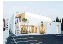
C2 三吉店 広島県福山市三吉町2-13-22 TEL.084-999-2226