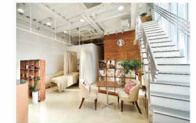
C2 エステ春日店 広島県福山市春日町1-1-43 TEL.084-945-2405