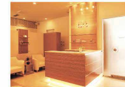
カツエステ東尾道店 広島県尾道市高須町4755-2 TEL.0848-56-0773