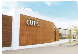
CUT·S 東尾道店 広島県尾道市高須町4755-2 TEL.0848-56-0773