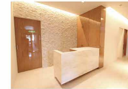
ミスティック宮通り店 広島県福山市元町13-20 1F TEL.084-971-7199