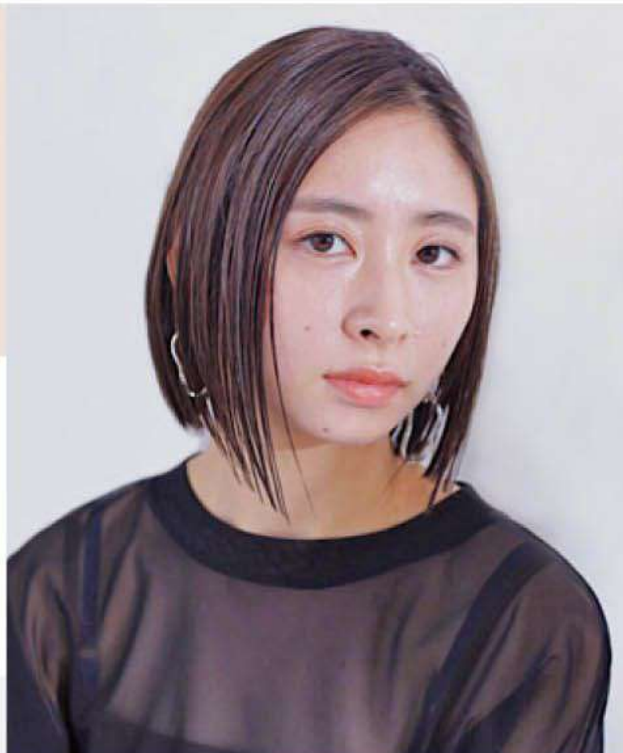
スーパーフラットラッシュ/Cカール/太さ0.15mm/長さ8~11mm/目尻長め eyelash&make / C2エステ春日店 河内 愛 hair / CUT・S川口店 貞宗 裕英