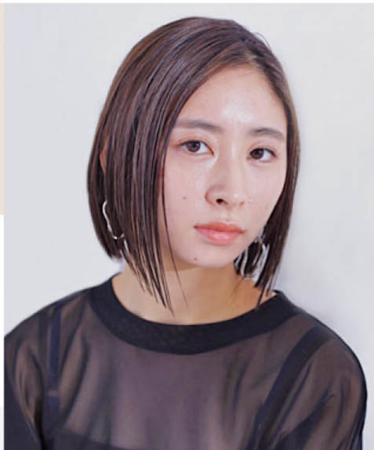
スーパーフラットラッシュ/Cカール/太さ0.15mm/長さ8~11mm/目尻長め eyelash&make / C2エステ春日店 河内 愛 hair / CUT・S山口店 貞宗 裕英